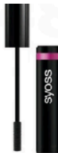
Máscara cubre canas, Syoss (7,50 €).

Lava el pelo con acondicionador, o ser posible el día anterior. Haz la raya en medio y seca pasando un cepillo redondo grueso, dejando las puntas con algo de forma (no lo planches). "Reserva los mechones delanteros y carda la coronilla, puliendo la superficie para que no quede encrespado", apunta la estilista Noelia Jiménez. Amarra la parte trasera en una coleta baja y recoge en un moño desestructurado. Coloca los mechones laterales tras las orejas. Al ser pulido, este peinado puede dejar a la vista las canas. Camúflalas con un corrector.