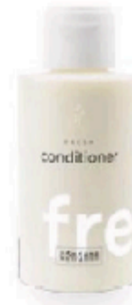
Fresh conditioner, Ringana (14,90 €).